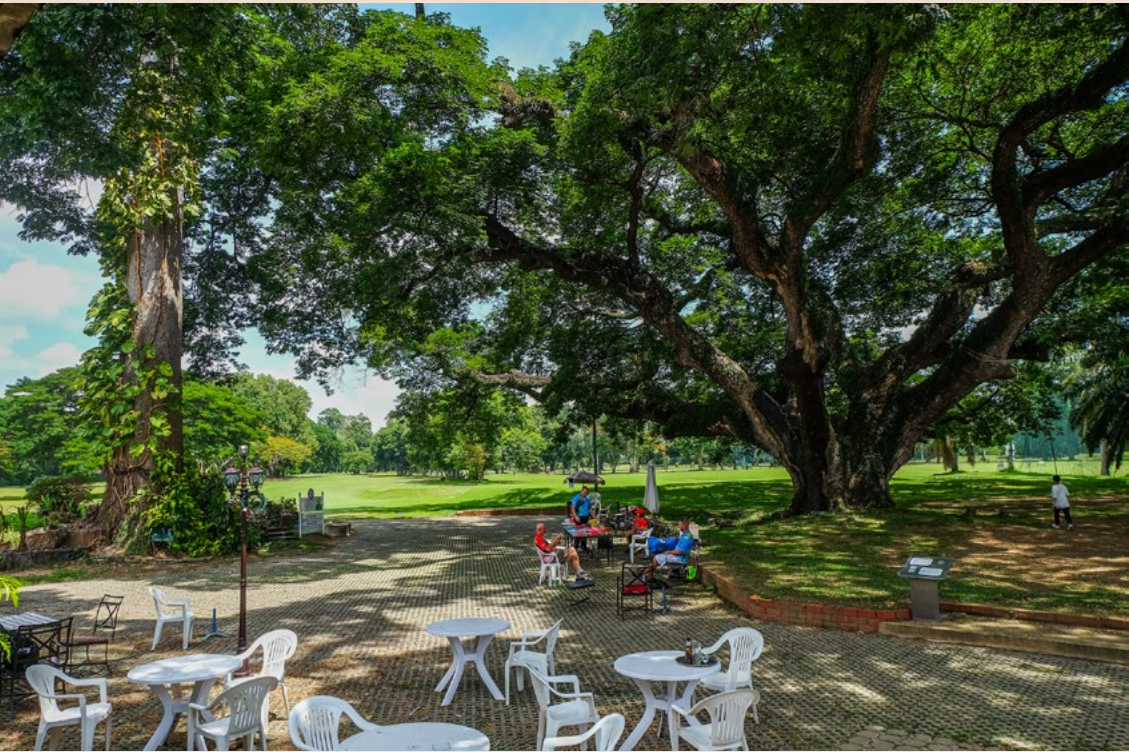
Clockwise from Top Gymkhana Club: the terrace is shaded by a huge rain tree