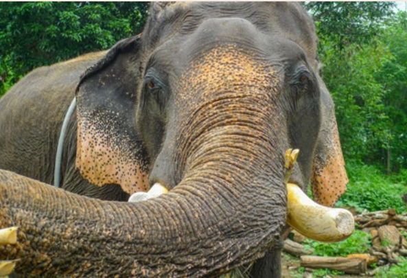
Below Teak logging would be unthinkable without the assistance of elephants