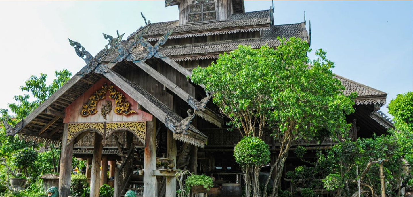
Clockwise from Top Traditional Northern-style teak house in Phrae