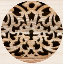
ตามเข็มนาฬิกา จากบน ไม้สักที่แกะสลัก ลวดลายสุดวิจิตร ในจังหวัดแพร่

เมื่อศตวรรษที่ 19 สยามคือดินแดนตะวันออกไกลแสนลึกลับที่น้อยคนจะมีโอกาสได้เดินทางมาหรือแม้กระทั่งฝันถึง จวบจนวาระที่พระบาทสมเด็จพระจอมเกล้าเจ้าอยู่หัว รัชกาลที่ 4 และเซอร์จอห์น เบาว์ริง ได้ลงนามในสนธิสัญญาเบาว์ริง ซึ่งเปิดศักราชการค้าระหว่างราชอาณาจักรสยามกับจักรวรรดิอังกฤษ และทำให้สินค้าพื้นเมืองของสยามอย่างไม้สักและงาช้างกลายเป็นสินค้าที่ตลาดทั่วโลกต่างต้องการ ในยุคดังกล่าว ราชอาณาจักรล้านนา ซึ่งประกอบด้วยดินแดนรอบๆ จังหวัดเชียงใหม่ในปัจจุบัน ยังเป็นรัฐเอกราชที่มีความสัมพันธ์อันดีกับพระมหากษัตริย์แห่งสยาม นอกจากเครื่องบรรณาการที่เจ้าผู้ครองล้านนาส่งลงมาให้กับพระนคร สิ่งหนึ่งที่ทำให้เชียงใหม่มีความสำคัญต่อสยามคือป่าไม้อุดมสมบูรณ์ ที่มีไม้สักเป็นจุดเด่น ซึ่งกระตุ้นความสนใจของเจ้าอาณานิคมอย่างอังกฤษและฝรั่งเศส เพราะไม้สักคือไม้ตัวเลือกลำดับต้นๆ ของการต่อเรือ และการจะเป็นเจ้าอาณานิคมในยุคสมัยดังกล่าว เรือคือพุนอำนาจอันทรงพลัง และช่วยสนับสนุนการเดินทางออกค้นหาอาณานิคมใหม่ๆ บริษัทการค้าอย่าง Borneo Company และ Bombay Burmah Trading Company ต่างเข้ามาตั้งสำนักงานในพระนคร พร้อมกับส่งตัวแทนเข้ามาเจรจาเกี่ยวกับผู้ครองนคร เพื่อย่อสืบทอดการทำป่าไม้ในภาคเหนือ